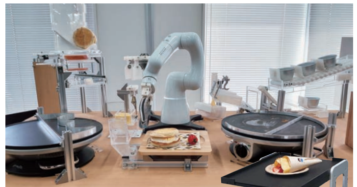
COBOTTA: English Muffin Production System

音声対話、様々な動きが可能なAIコミュニケーションロボット「Kebbi Air」による施設案内と子ども向けの遊びコンテンツを提供します。イオンモール常滑の店舗・イベント情報をプログラミングし、知りたい内容に合わせて音声と画面表示でお伝えします。また、高校生が制作した子ども向けのゲームも体験していただけます。